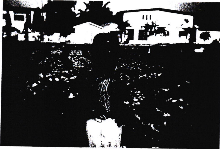
Şekil 1. Gana'da atıksu ile sulama

Ancak nitrat miktarları çok yüksek olan geri kazanım suları bitki gelişimine engel teşkil edebilmektedir. Ayrıca, sürekli geri kazanım sularıyla sulanan topraklarda tuzlanma, çözülmüş katıların ve ağır metallerin birikmesi gibi sorunlar oluşabilmektedir. Bu nedenle bu suların sulamada kullanımında toprak kalitesine ve sulanacak bitki türüne göre sulama yapılması önem taşımaktadır. Geri kazanım suları çoğunlukla yem bitkilerinin, lifli bitkilerin, sınırlı olmakla birlikte orkide bahçelerinin ve üzüm bağlarının sulanmasında kullanılmaktadır.