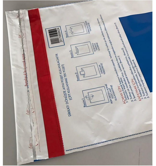
Resim-8 Sınav güvenlik poşetini Resim-8'deki gibi ağzı kapalı olarak bina sınav komisyonuna teslim ediniz.

İletişim Numaraları: 0 312 413 46 16- 413 32 80 - 413 32 83 - 413 32 47- 413 32 48