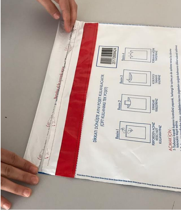
Resim-7 Kırmızı şeride dokunmayınız.

Resim-6'daki gibi üst kısmından tutarak yapışkanlı alana yapıştırırız.